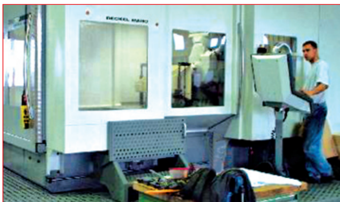
5-osé obrábacie centrum programované a využívané učňami v rámci duálneho vzdelávania. U nás táto bežná technológia bola povýšená v rámci neznalosti na „ťažký výskum“.