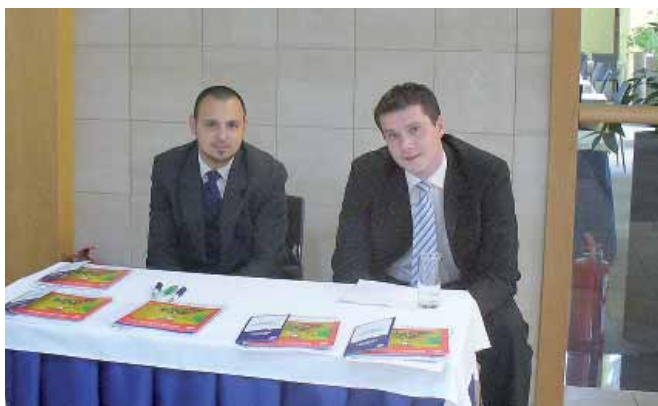
Zástupcovia generálneho partnera SŽK - VÚB, a.s.