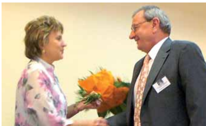
Gratulácia novozvolenému predsedovi