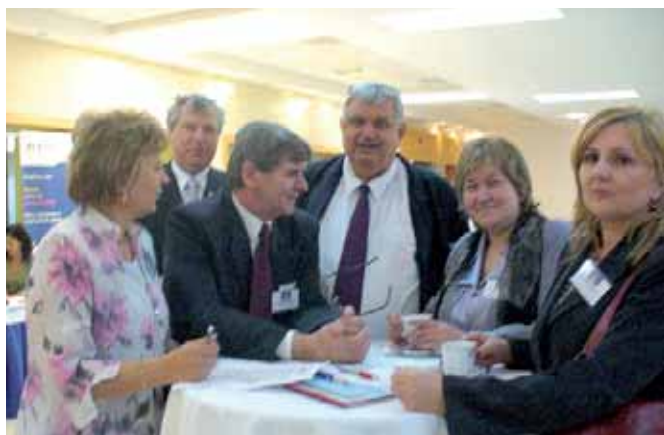
V prestávkach zhromaždenia nechýbali ani neformálne debaty...