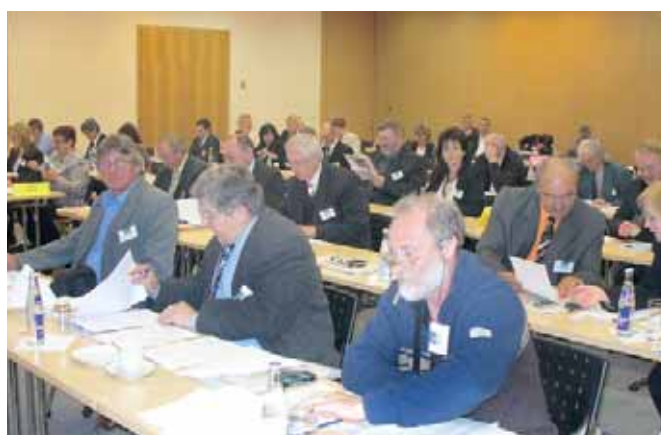
Pohľad do zasadacej miestnosti v budove Technopolu v Bratislave