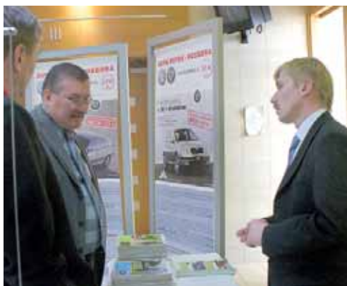
AUTOROTOS - Rozbora