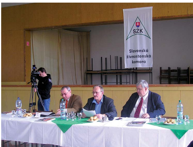
Fotodokumentácia zo zhromaždenia delegátov bratislavskej kraj- skej zložky, ktorá sa konala 19. marca v Pezinku.