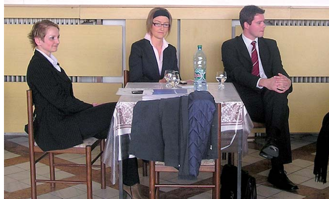
Zástupcovia generálneho partnera SZK - Všeobecnej úverovej banky na zhromaždení delegátov KZ Bratislava